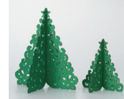
グリーン03 ゴールド09