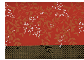
レッド61 ☆ホワイト10→P9使用商品