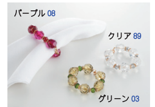
パープル08 クリア89 グリーン03