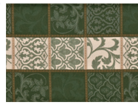
ダークグリーン53 ☆レッド61→P4使用商品