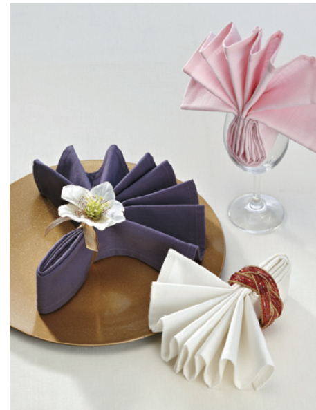
デリシャスカラーナプキン手前：カマンベール 中央：ブルーベリー 奥：シャンパン